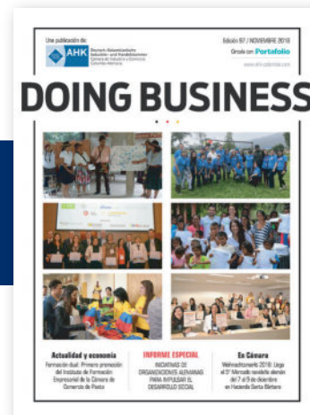
NOVIEMBRE Inversión social

Un agradecimiento especial para nuestros pautantes anuales: